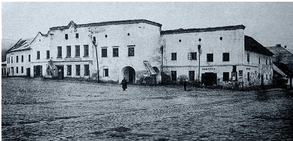
VLEVO BUDOVA RADNICE, VPRAVO HOSTINEC „NA ROŽKU“ DNES JE V TÉŽE LOKALITĚ SITUOVÁNA RESTAURACE DOLCE VITA.

KROMĚ HOSTINCŮ ZDE BYLA I KAVÁRNA. KAVÁRNA „SUSKOVA“ LEPŠÍ PODNIK S PIANEM, KULEČNÍKEM I POSEZENÍM VENKU, BÝVAL MÍSTEM DOSTAVENÍČEK ZLÍNSKÉ LEPŠÍ SPOLEČNOSTI. PO MODERNIZACI NÁMĚSTÍ ZANIKAJÍ NEJENOM TYTO, ALE I VĚTŠINA OSTATNÍCH PODNIKŮ.